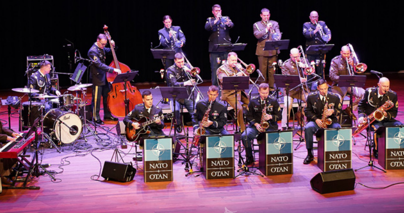
(SHAPE International Band)