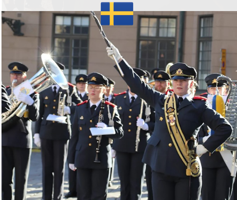
(Home Guard Band of Eksjö)

Under tattoooföreställningen genomför kåren ett gemensamt framträdande med sina kollegor i Hemvärnets musikkår Ystad.